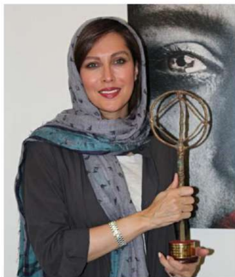
Diseñado por el famoso escultor indio Velu Vishwanadhan radicado en París.

Mejor Filme Mejor Dirección Mejor Actor Mejor Actriz Mejor Guión Mejor Fotografía Mejor Edición Mejor Música Mejor Diseño de Sonido Mejor Historia Original Mejor Producción Mejor Documental