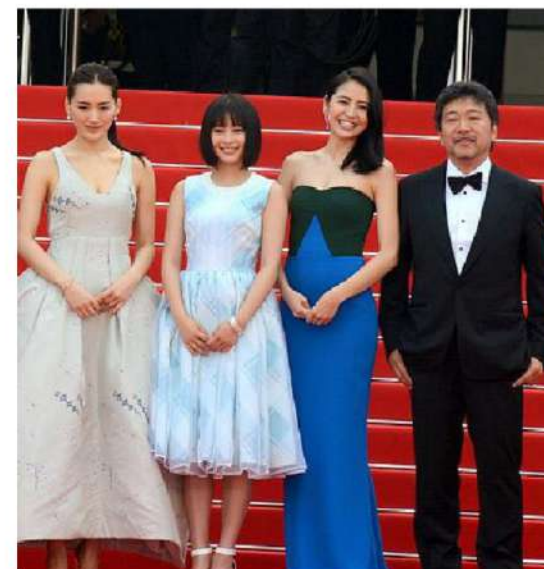
HIROKAZU KOREEDA (Japón)

Wong Kar Wai es un director de cine, guionista y productor de Hong Kong. Sus películas se caracterizan por narrativas no lineales, música atmosférica y una cinematografía vívida que involucra colores atrevidos y saturados. Wong, figura fundamental del cine de Hong Kong, es considerado un autor contemporáneo y ocupó el tercer lugar en la encuesta de Sight and Sound de 2002 sobre los mejores cineastas de los 25 años anteriores. Sus películas aparecen con frecuencia en listas de las mejores a nivel nacional e internacional.