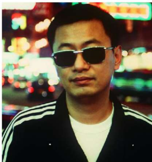
WONG KAR WAI (Hong Kong)

Wong Kar Wai es un director de cine, guionista y productor de Hong Kong. Sus películas se caracterizan por narrativas no lineales, música atmosférica y una cinematografía vívida que involucra colores atrevidos y saturados. Wong, figura fundamental del cine de Hong Kong, es considerado un autor contemporáneo y ocupó el tercer lugar en la encuesta de Sight and Sound de 2002 sobre los mejores cineastas de los 25 años anteriores. Sus películas aparecen con frecuencia en listas de las mejores a nivel nacional e internacional.